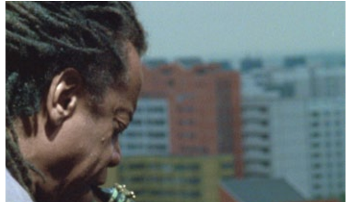
Anri Sala: Long Sorrow, 2005