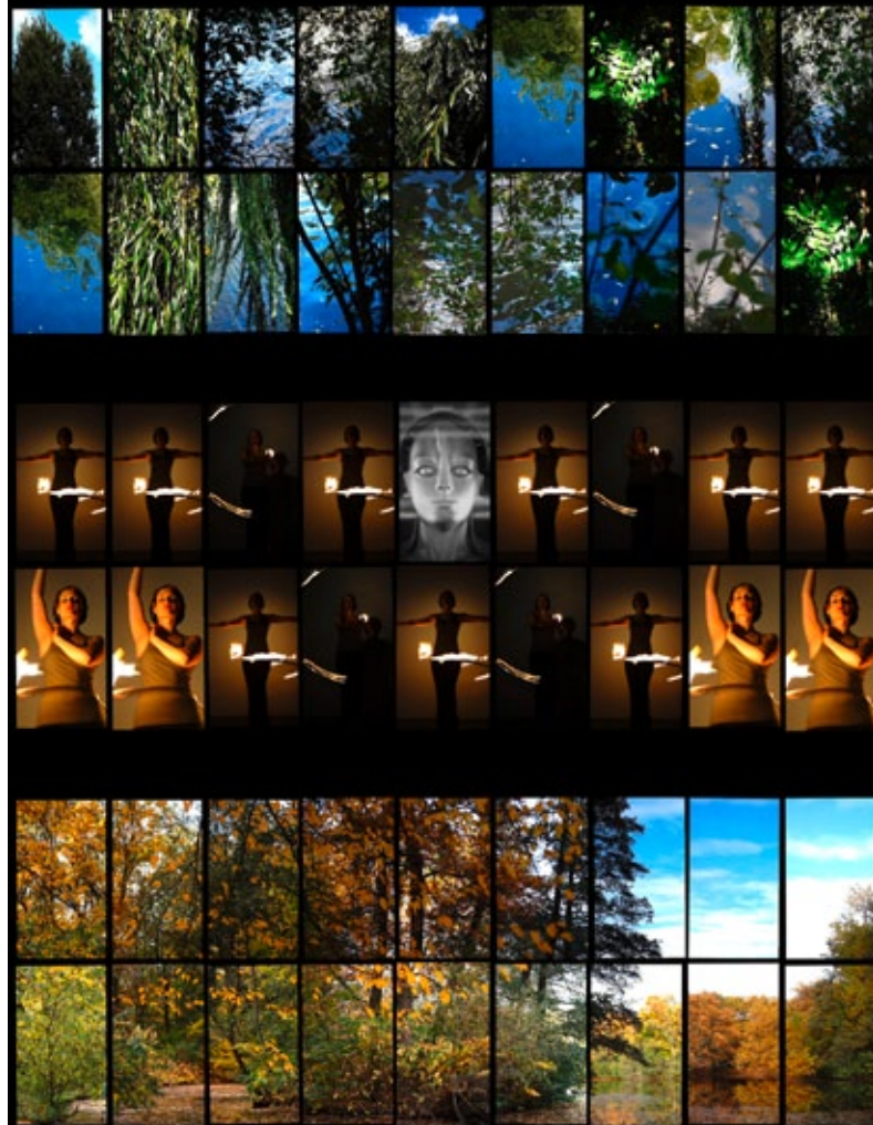
Theo Eshetu: Videostills von / from »Kiss the Moment«, 2015

In his video installation, the Ethiopian Theo Eshetu deals with the German Academic Exchange Program scholarship that enabled him to come to Berlin. »Kiss the Moment« is diary, homage, and essay