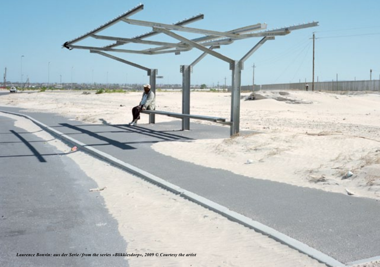
Laurence Bonvin: aus der Serie / from the series »Blikkiesdorp«, 2009

at once. 18 monitors form a »window grille.« An associative city trip unfolds: parks, dance performances, burlesque shows, architectures, love stories. In his work, Berlin can look romantic like the setting for an opera, dramatic like a Fritz Lang movie, or oriental like the tiles in the zoo aquarium. The work intuitively finds diverse connections between the cultures that meet in Berlin.