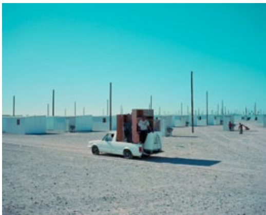
Laurence Bonvin: aus der Serie / from the series »Blikkiesdorp«, 2009 © Courtesy the artist

Künstler geht es um das historische Gedächtnis der Städte, das sich in ihre Klänge eingeschrieben hat. Bei einem Aufenthalt in Mexiko City lauschte er den »Organillos«, die in Parks auf ihren verstimmten Leierkästen alte Revolutionslieder spielten. Sonntag entdeckte dabei den Schriftzug einer Berliner Drehorgelbauer-Dynastie: »Harmonipan – Frati & Co, Schönhauser Allee 73«. Ende des 19. Jahrhunderts, als die Firma ihre Instrumente nach Mexiko lieferte, zogen noch über 3.000 Leierkastenmänner durch die deutsche Hauptstadt. Nun ist im Inneren der KunstHalle Sonntags Videoarbeit »Sonntag im Park« zu