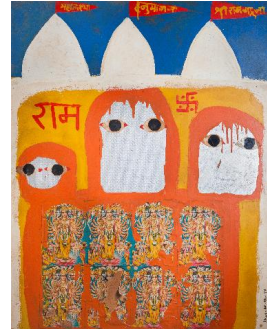
Bhupen Khakhar, You Can't Please All , 1981, Ölfarbe auf Leinwand, 175,6x175,6 cm, Courtesy Tate Collection, London T07200, Ankauf 1996; Landscaping on Head , 1985, Aquarell auf Papier, 64x50 cm, Sammlung Deutsche Bank; Man Leaving (Going Abroad) , 1970, Ölfarbe auf Leinwand, 105,5x105 cm, Tapi Collection, Indie; Interior of a Hindu Temple III , 1965, Bedrucktes Papier, Farbe & Silberfolie auf Karton, 116x90 cm, Courtesy Museum of Art & Photography (MAP), Bangalore © Estate of Bhupen Khakhar